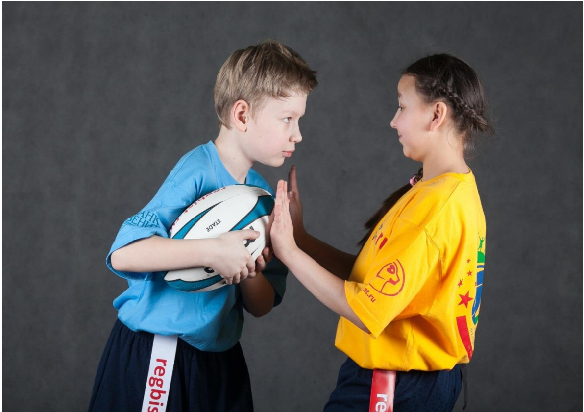
Фотография № 5. Нарушение правил в нападении