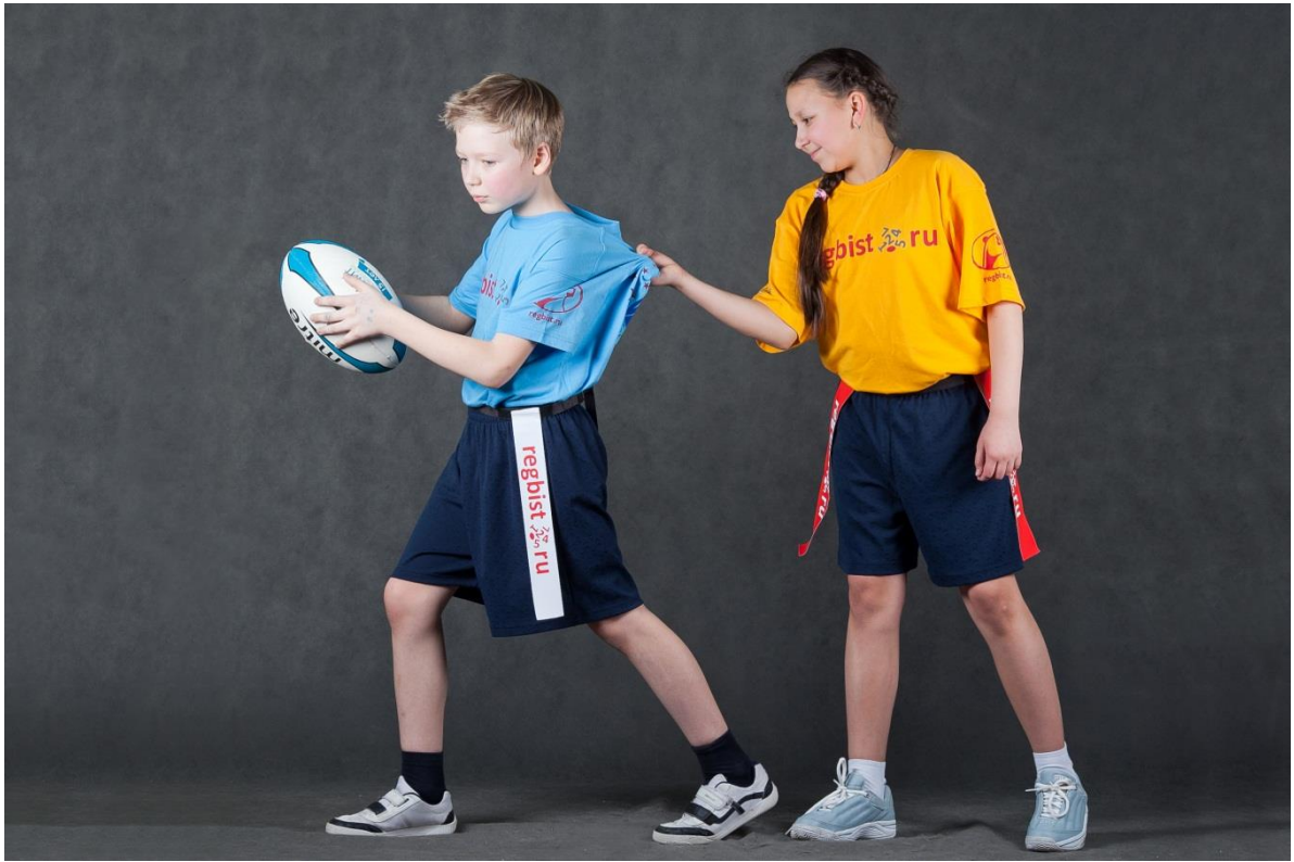
Фотография № 7. Нарушение правил в защите

Нарушение правил в защите. Судья назначает штрафной удар, если нарушение правил происходит в следующих обстоятельствах: