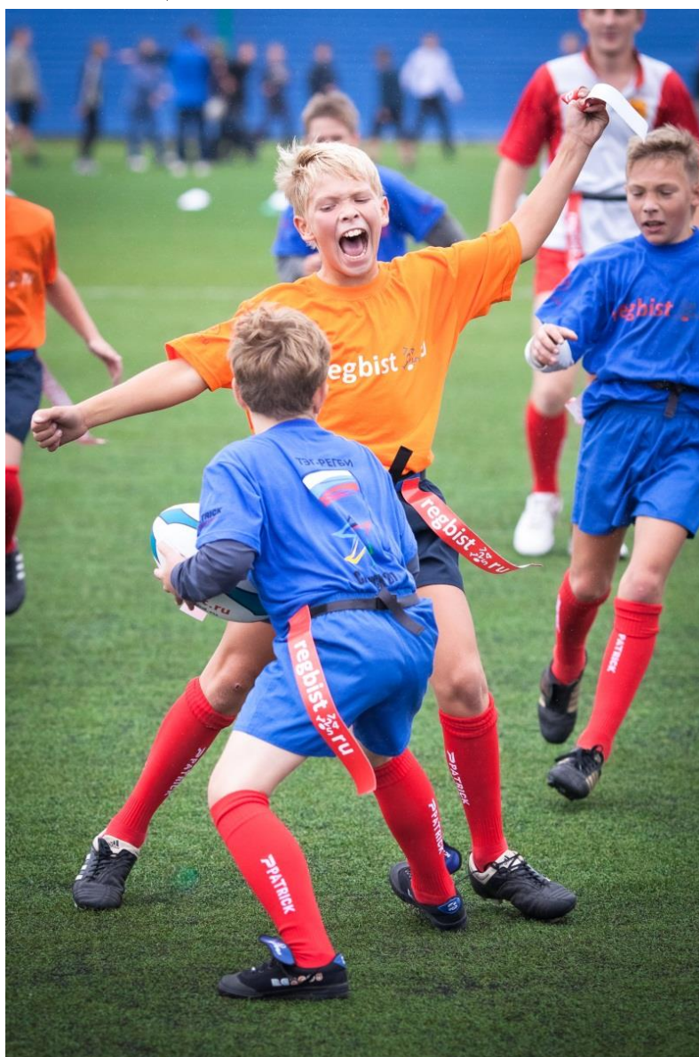
Фотография № 8. I Всероссийский турнир «Регби – детям России» (III Международный спортивный форум «Россия – спортивная держава», г. Саранск, 2011 год)

Попробуйте с ребятами играть в бесконтактный вид регби и ваши занятия станут более динамичными и захватывающими!