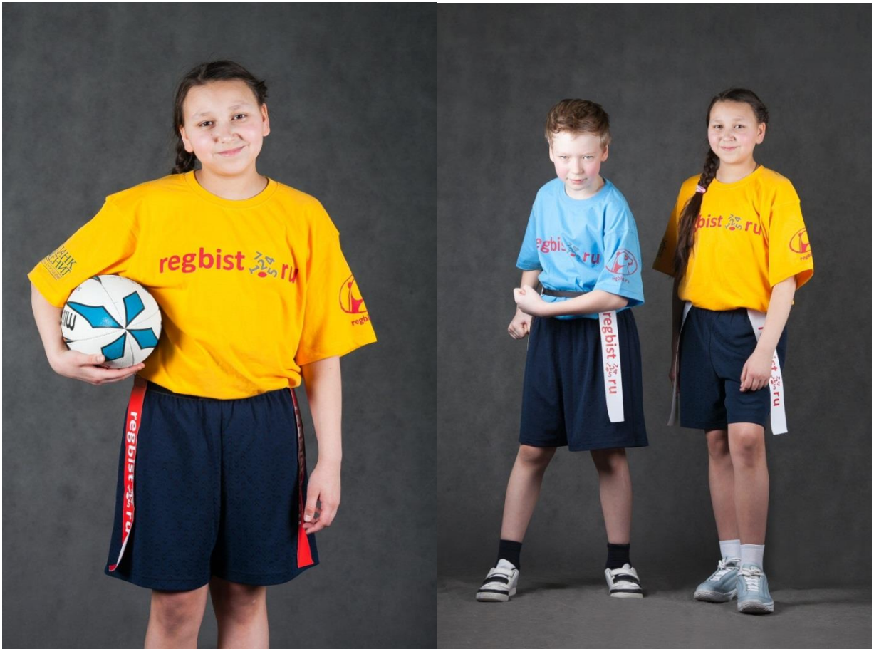
Фотография № 1, 2. Как правильно крепить «тэг» пояс и «тэг» ленты

Каждую команду можно отличить по цвету «тэг» лент на игроках.