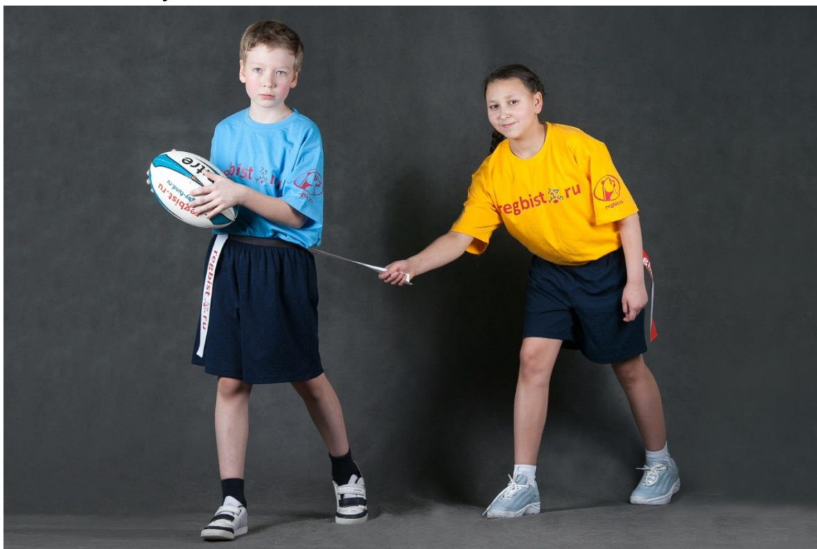
Фотография № 4. «Тэг»

Тэг. Срывание «тэг» ленты с «тэг» пояса соперника. Только у игрока с мячом можно срывать «тэг» ленту.