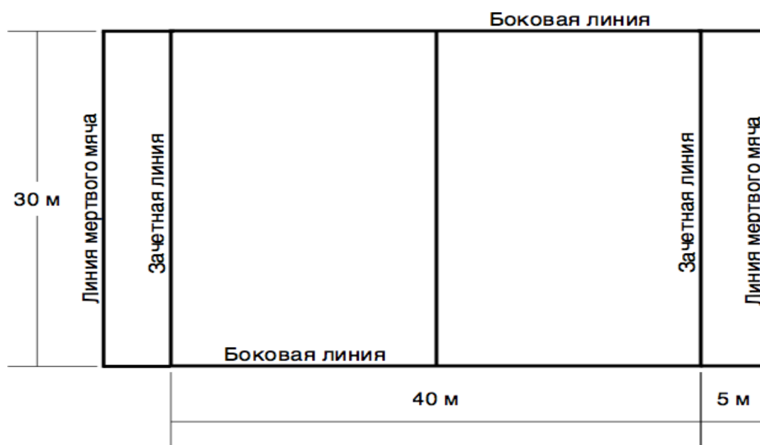
Рисунок № 2. Пример разметки площадки для игры тэг – регби

Разметку поля производят в соответствии с рисунком 2.