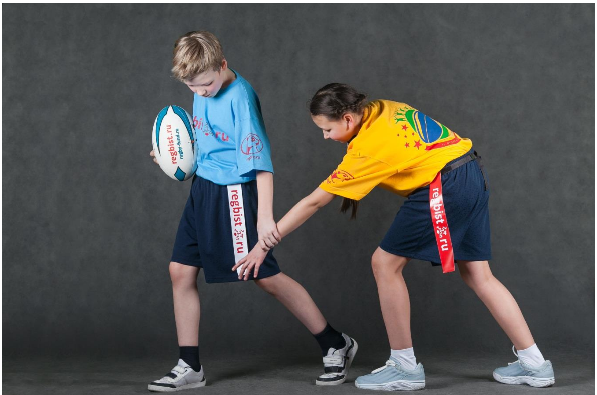
Фотография № 6. Нарушение правил в нападении