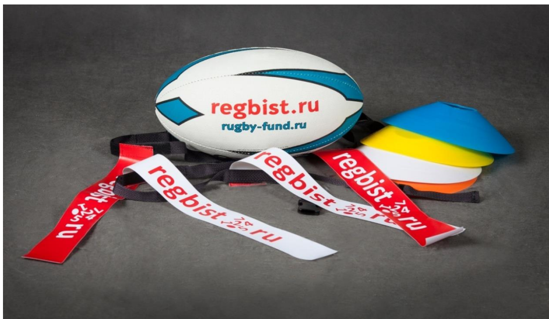
Фотография № 3. Спортивный инвентарь («тэг» пояс, «тэг» ленты, фишки, мяч)

Спортивный инвентарь. Для игры понадобится регбийный мяч (размер 3 и 4). Для разметки игровой площадки, можно использовать «маркеры» или так называемые фишки. Маркеры необходимы для разметки границы спортивной площадки. Использование разноцветных маркеров применяется для быстрой ориентации и различения разметки на игровой площадке в ходе игры.